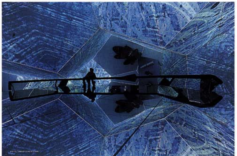
Der verspiegelte Sternendom des „Kometor“ © Manfred Hebenstreit, Foto: Christoph Hilger

Wer den immerhin acht Meter hohen Sternendom erleben will, muss sich ganz der Wirkung des Raumes ausliefern: Spiegel bedecken den gesamten Boden und einen Teil der Wände. Durch diese komplexe Anordnung scheinen