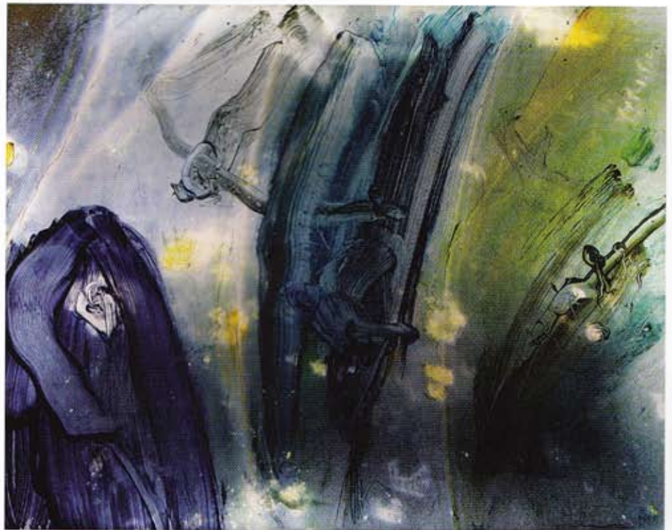
Manfred Hebenstreit; Glasleuchtbild aus der Serie „Kuranda, Australische Wasserbilder“ 2010; 80 cm x 100 cm, Mischtechnik auf Acrylgläsern © Manfred Hebenstreit

Diese Formen spielen auf die elliptischen Bahnen der Himmelskörper an und zeigen sich - aus allen Blickwinkeln - auch vielfach in den Spiegeln.