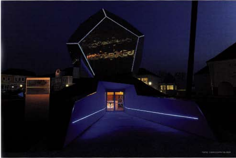
Der Eingang des „Kometor“ wirkt surreal © Manfred Hebenstreit, Foto: Christoph Hilger

Ort und zum Werk des Georg von Peuerbach. Der „Kometor“ ist ein Fünfeck-Körper, auch Dodekaeder genannt. In der Antike galt diese Form als Verkörperung des Weltalls und mit der Wiederentdeckung des antiken Wissens in der Renaissance griffen auch Künstler wie Leonardo Da Vinci oder Albrecht Dürer Fünfeckformen auf - auch von Johannes Kepler ist bekannt, dass er fasziniert war von „platonischen Körpern“, denen besondere Eigenschaften zugeschrieben wurden. Die schiefe Ebene, auf der die Skulptur tront, ist eine Anspielung an die „Schiefe der Ekliptik“. Und auch bei der 36 Meter hohen Nadel, die wie ein Zeigefinger in den Himmel deutet und nach Norden zeigt, sind Anklänge an Peuerbachs Untersuchungen zur „Missweisung der Kompassnadel“ durchaus beabsichtigt, denn die Künstler der Renaissance waren Universalisten, die in den verschiedensten Fachgebieten gleichzeitig tätig waren. Analog dazu ist auch der Himmelskörper als Gesamtkunstwerk konzipiert.